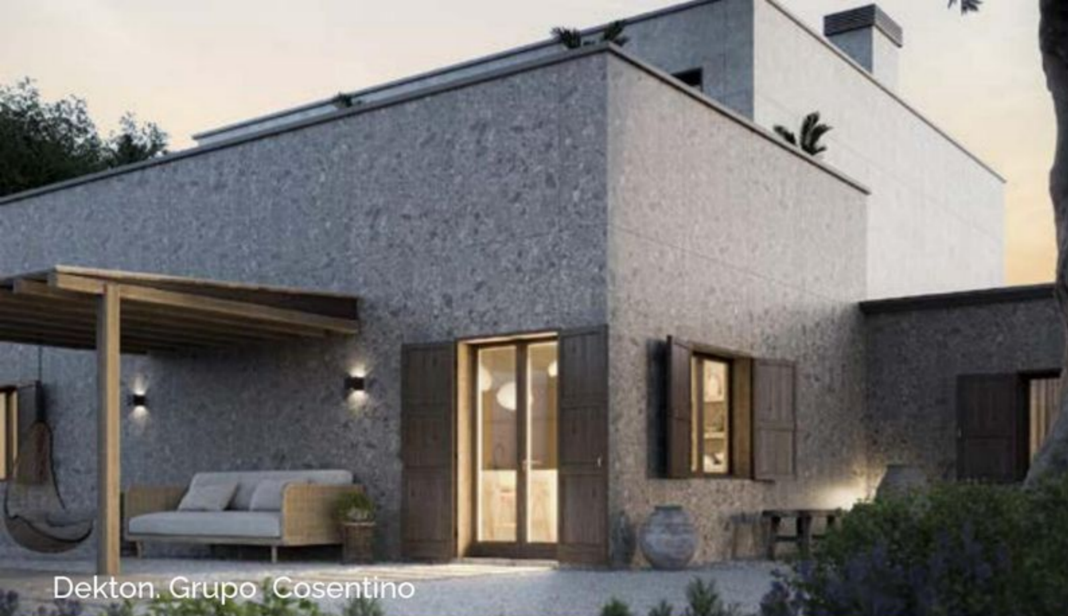
Dekton. Grupo Cosentino