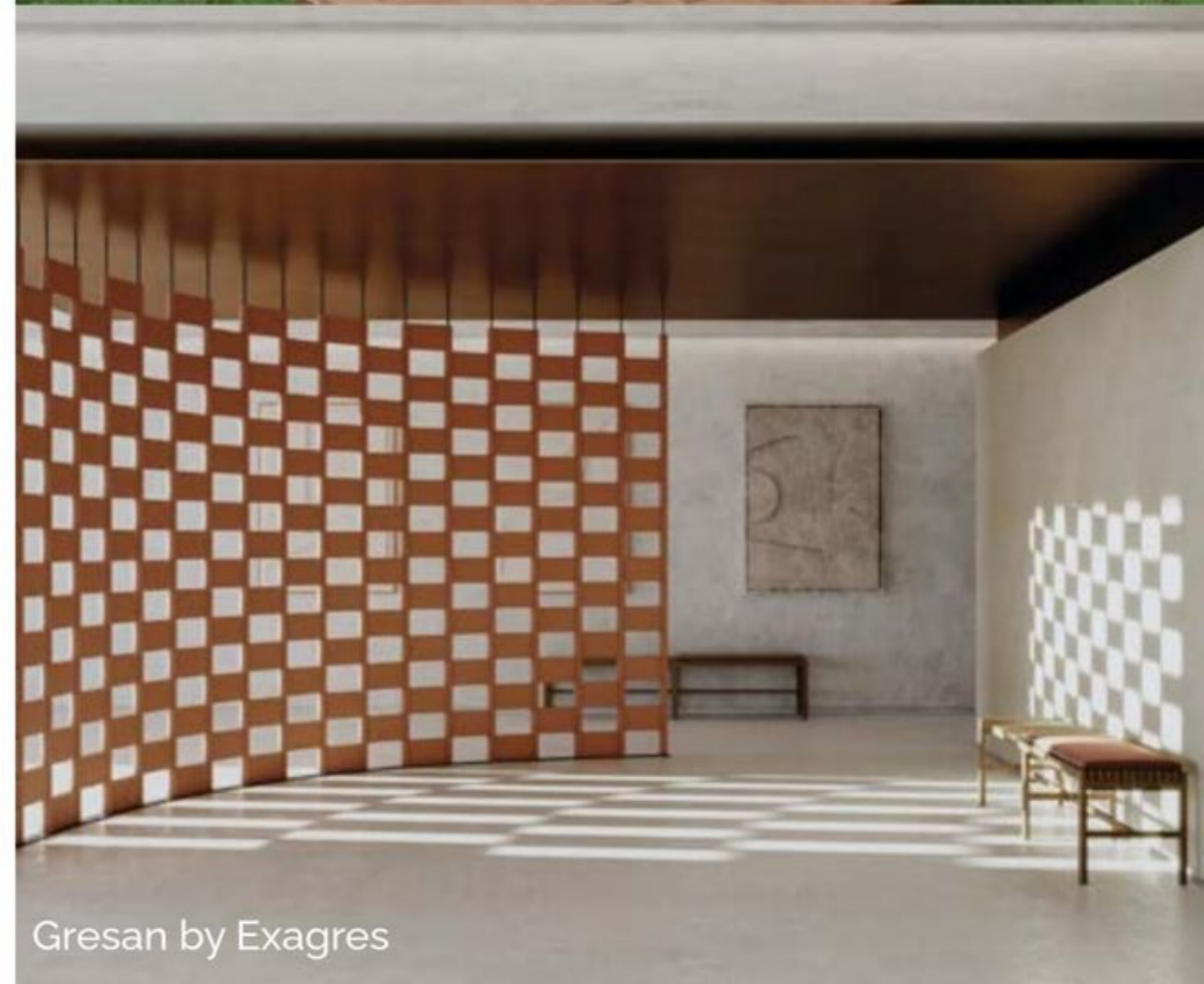
Gresan by Exagres